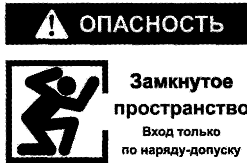
Рекомендуемый знак "ОЗП".

3. На арматуре блокировок должны быть вывешены таблички: "Не открывать! Работают люди"; "Не закрывать! Работают люди"; на ключах управления электроприводами отключающей арматуры: "Не включать! Работают люди"; на месте производства работ: "Работать здесь".